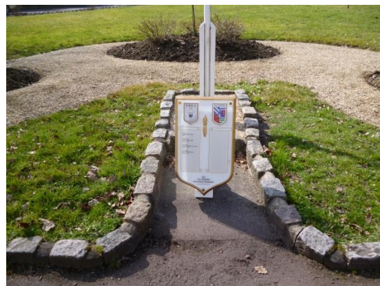
Nouvelle Plaque d'Hommage

Enfin pour des raisons sécuritaires, il a été procédé à l'Abattage du CYPRES et du CEDRUS Atlantica