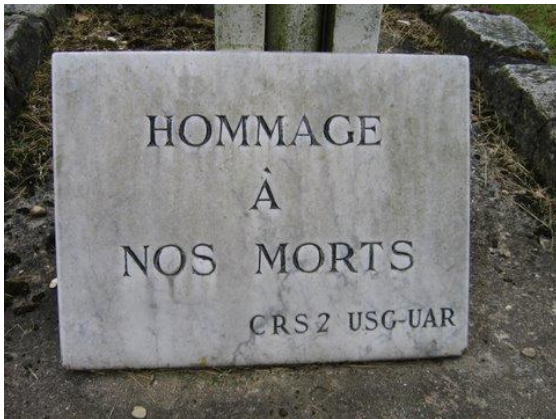
Ancienne Plaque d'Hommage